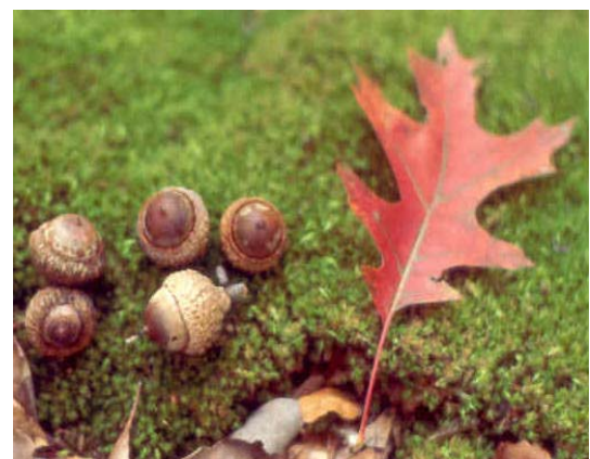
De Quercus coccinea kleurt prachtig rood in de herfst en vervalft in bronzen tinten. Een wonderlijke verschijning.

De Quercus coccinea of Scharlaken Eik heeft diep ingesneden bladeren en schuwt